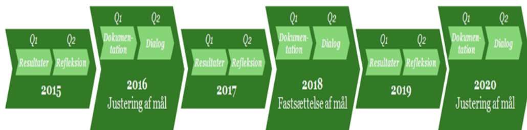
Figur 1 Tidsmæssig placering af dokumentation og dialog til brug for politiske ledelse i Børn og Skole