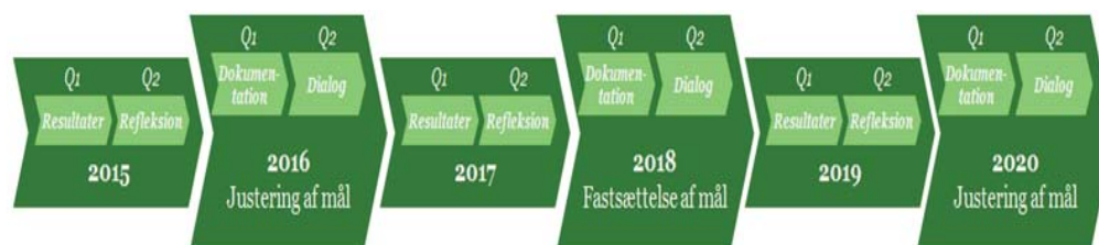
Figur 1 Tidsmæssig placering af dokumentation og dialog til brug for politiske ledelse i Børn og Skole